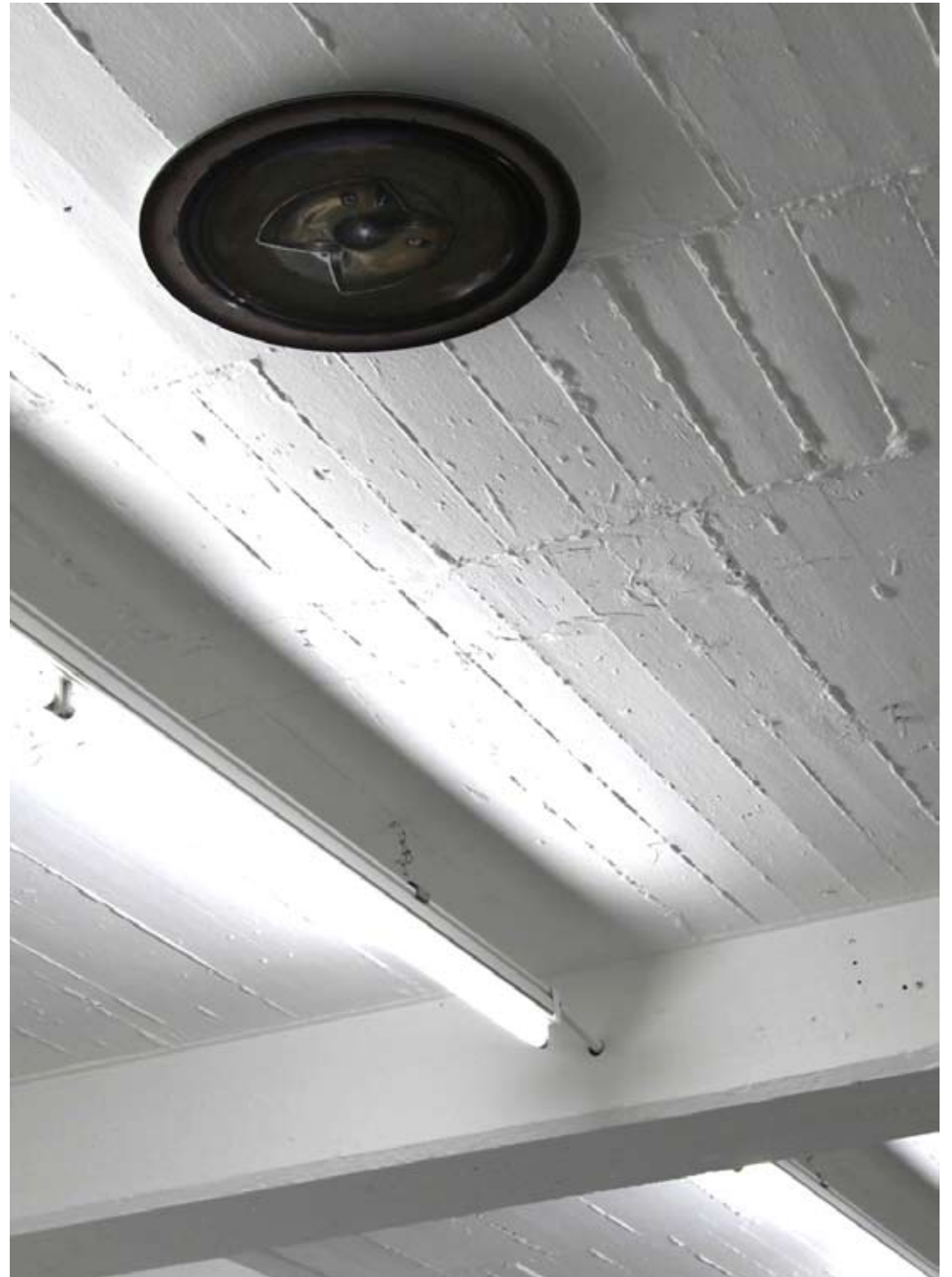
Straßenlaterne Mülheim Installationsansicht