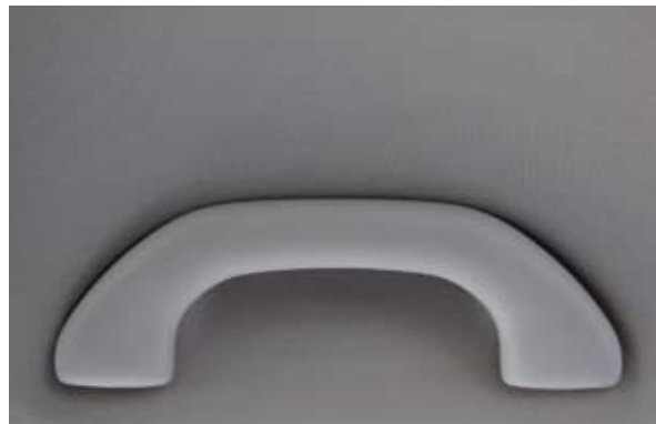
Griff 18 x 28 cm Lambda Print auf Aluminium 2010