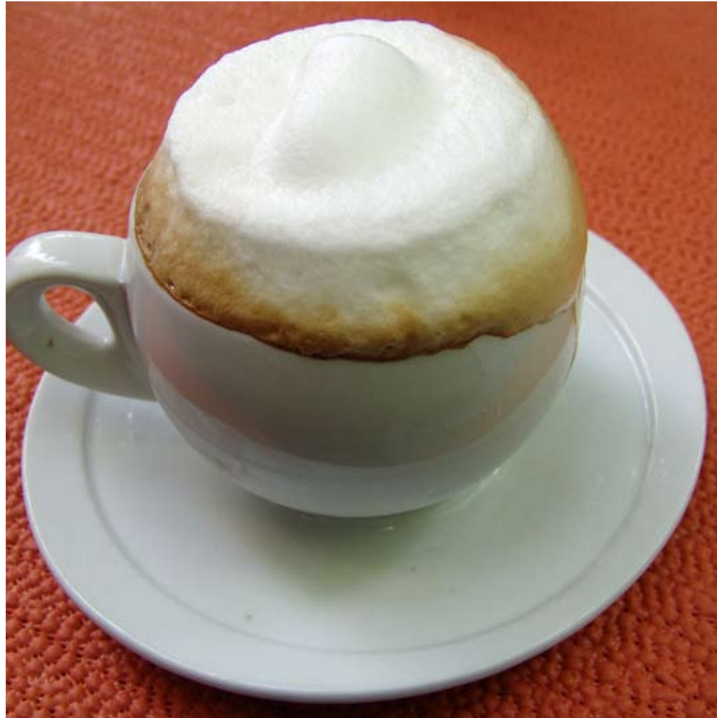
Kaffeetasse 13,5 x 13,5 cm Lambda Print auf Aluminium (Abbildung in Originalgröße) 2006