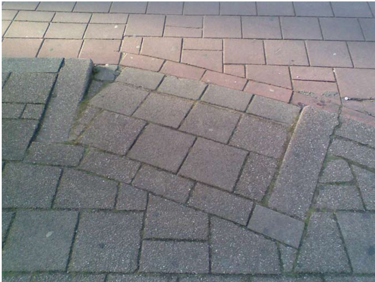
Gehweg Rotterdam 2-teilig/insgesamt 120 x 90 cm Inkjet Print auf Aluminium 2010