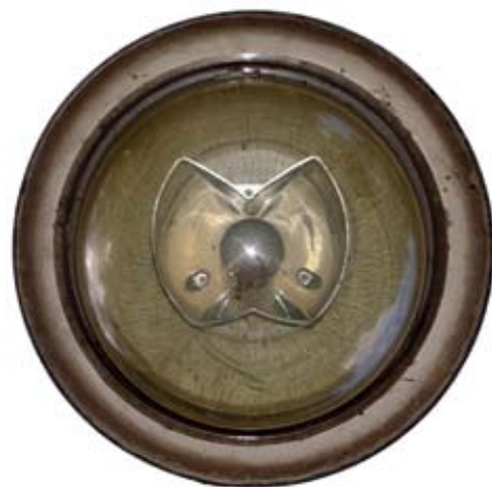
Straßenlaterne Mülheim Durchmesser 45 cm Inkjet Print auf Aluminium 2010