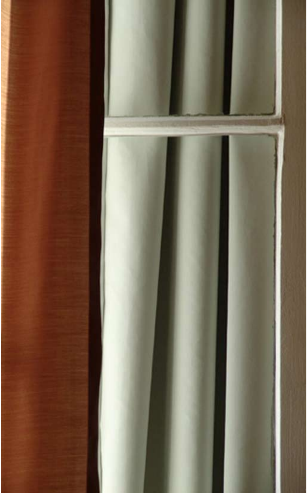
Vorhang 120 x 174 cm Lambda Print auf Aluminium 2008