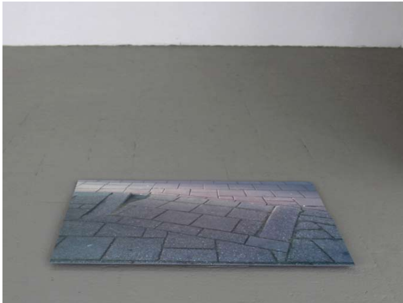
Gehweg Rotterdam Installationsansicht