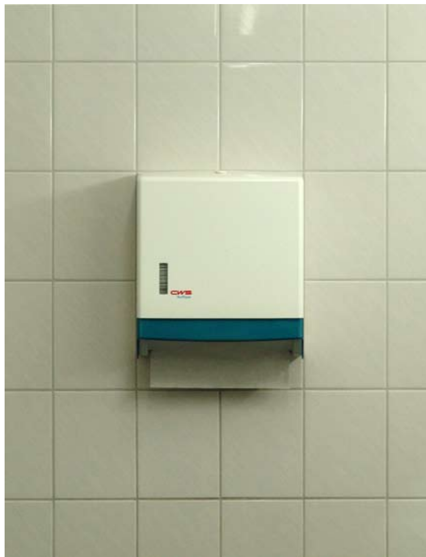
CWS 75 x 100 cm Lambda Print auf Aluminium 2008